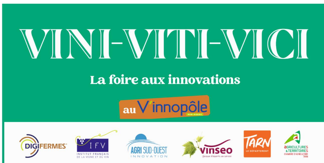
Exemple : Bâche annonçant l'évènement à l'entrée de la manifestation

Cet évènement, unique pour la filière Viti-Vinicole, ne pourrait être organisé sans le soutien logistique et financier du département du Tarn et de la Région Occitanie via le FEADER Communication.